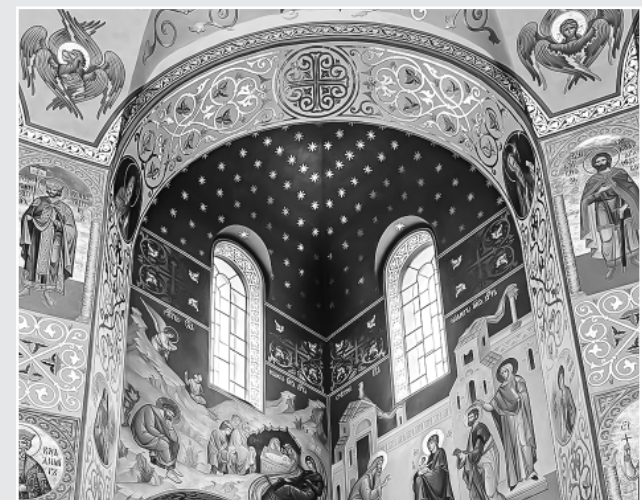
Фоторепортаж - на сайте епархии: tvereparhia.ru

Великое освящение собора планируется совершить в храмовый праздник – Воскресение словущее, 26 сентября 2026 года.