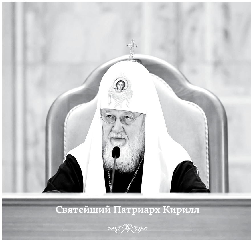
Святейший Патриарх Кирилл