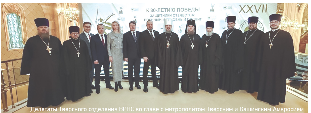
Делегаты Тверского отделения ВРНС во главе с митрополитом Тверским и Кашинским Амвросием

РУСЬ НЕПОБЕДИМА. РОССИЯ СТОЯЛА И БУДЕТ СТОЯТЬ Что показал День народного единства 2-3 стр. >>>