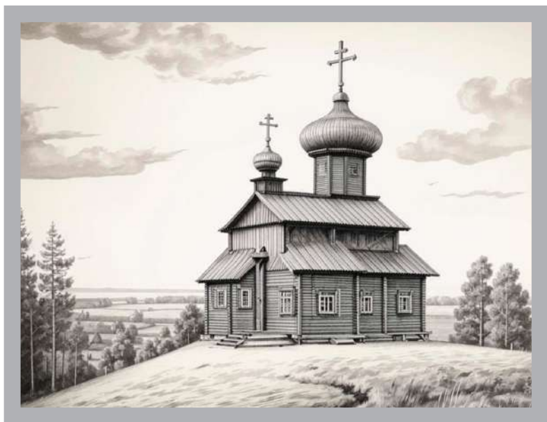
Так выглядела, в представлении Искусственного интеллекта предшественница собора церковь в честь святых бессребренников Космы и Дамиана

После совершения великого освящения вну- тренние работы в храме продолжались, и в 1292 г. он был расписан. По сообщению летописца, в этот год «иконописци подписаше на Тфери цер- ковь камену святого Спаса», и данное известие подтвердили археологические изыскания 2012– 2014 гг.: ученым удалось обнаружить в земле небольшие фрагменты штукатурки с остатками древних росписей, и их анализ позволил предпо-