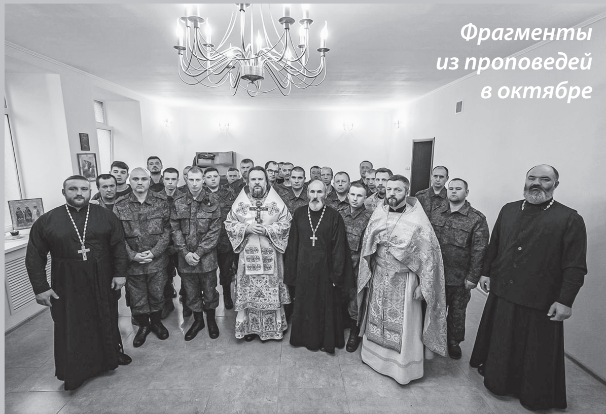
На снимке: после Причащения Святыми Тайнами мобилизованных военнослужащих.