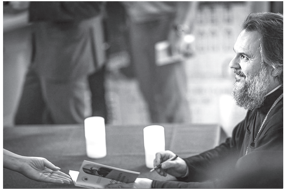
В Твери в молодежном культурном центре «Пространство возможностей «Дом 36»»

Есть множество различных способов решения проблемы зла, или проблемы «теодицеи», как называл ее Г. Лейбниц, что означает «защиты Бога». Во все времена много копий было сломано на эту тему. Наиболее простой из способов теодицеи подразумевает разговор о свободе. Бог не творит зло, но Он предоставляет Своему творению свободу. И зло, к сожалению, является побочным продуктом свободы. В том смысле, что коль скоро некто свободен, то он может выбрать творить и добро, и зло. И когда он выбирает зло, то этим самым он его и творит. То есть зло появляется там, где человек, будучи свободным, свободно же выбирает не добро, а зло. Тут нет речи о том, что Бог имеет отношение к