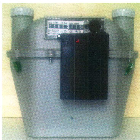
в) Общий вид счетчиков газа СГМН-1R-х-х-Gx