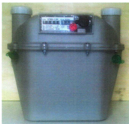
а) Общий вид счетчиков газа СГМН-1-х-х-Gx

Общий вид счетчиков представлен на рисунке 1.