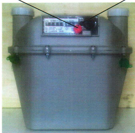
Рисунок 2 – Схема опломбирования счетчика, обозначение мест нанесения знака поверки

Место пломбирования и нанесения оттиска знака поверки