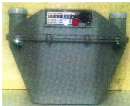
б) Общий вид счетчиков газа СГМН-1И-х-х-Gx