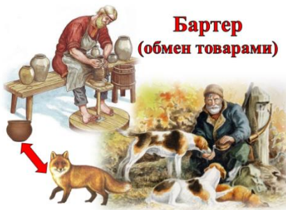
Бартер (обмен товарами)

Слайд – 4 И у одного отлично получалось лепить глиняные горшки, но никак не получалось поймать лису, а у другого - наоборот. И пришла людям в голову мысль: можно меняться продуктами своего труда. Я тебе - лису, а ты мне - большой горшок для варки похлёбки. Такой обмен теперь называется бартер .