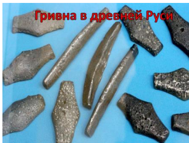
Гривна в древней Руси

Педагог: -Представьте, вы идете в магазин что-нибудь купить и вам надо взять с собой быка или мешок зерна? Это неудобно, потому что занимает много места, их нельзя положить в карман, как деньги.