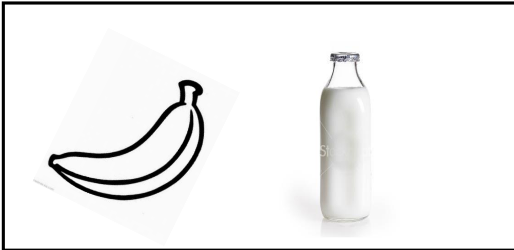
карточки - подсказки