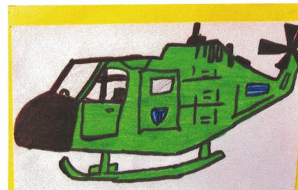
Рисунки В.Грибского, 7 класс