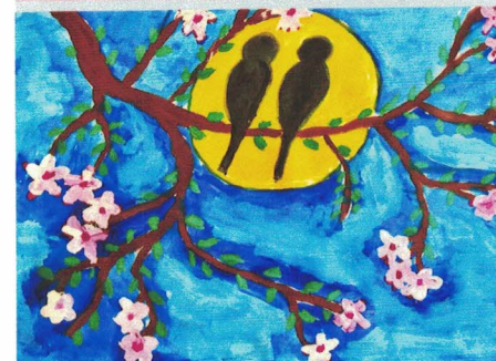
Рис. Александры Смаги