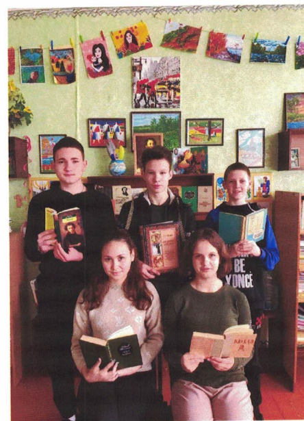
Материал подготовил Александр Миков