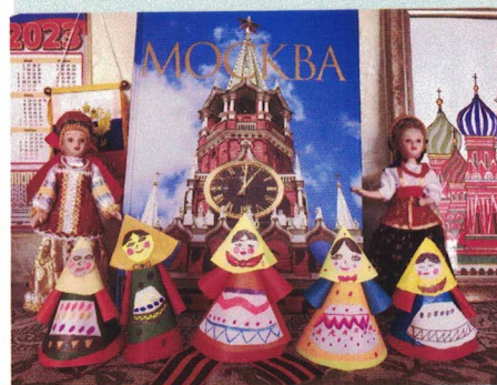
Дружные матрёшки. Выставка работ обучающихся 3 класса в школьном музее