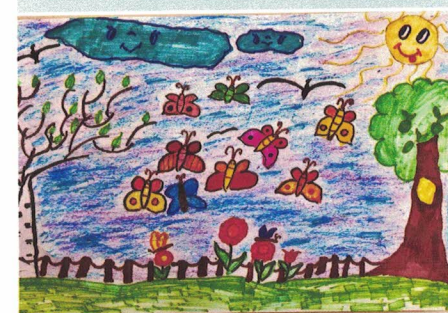
Рис. Margarиты Николаенко