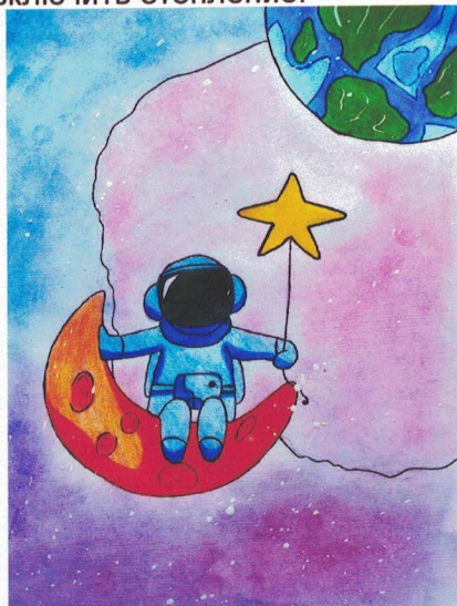
Рис. Артёма Ангелиса, 9 кл.

Но как только мы вышли в тень, ужасный мороз сковал наши движения. Еле успели включить отопление.