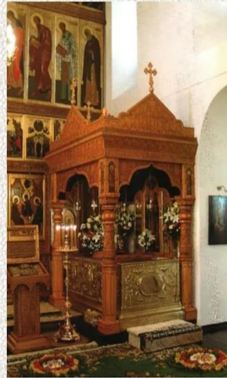
Рака с мощами Св.Петра и Февронии в Троицком храме города Мурома