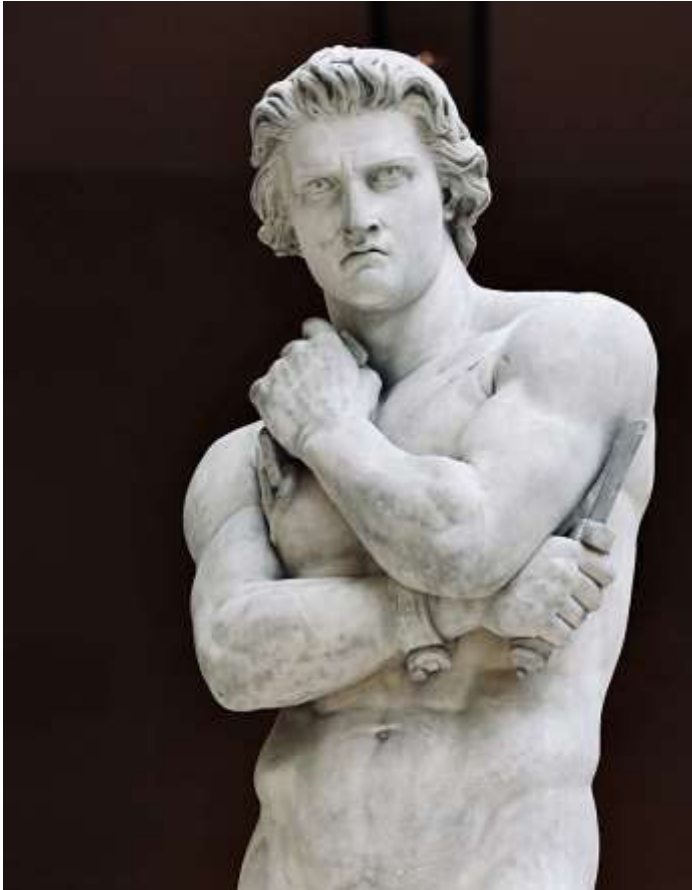
«Спартак» (1830) Скульптор: Дени Фойатье

Отличавшийся «не только большой смелостью и физической силой, но умом и гуманностью. Этим он значительно превосходил других, будучи гораздо более похожим на эллина».